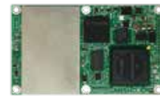
Avanzado BD970 OEM es un receptor multiconstelación compacto diseñado para ofrecer una precisión centimétrica para una variedad de aplicaciones.